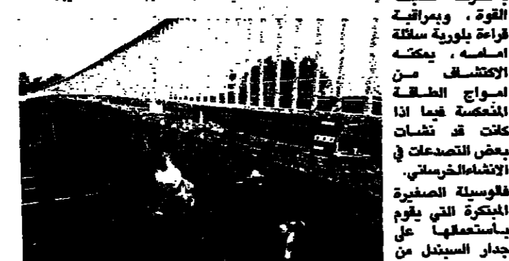
يقوم مهندس بطرق على جسر لطريق الخرسانة المسلحة بمشرفة شخيت القوة ويمرارة قارة بلورية مائلة اسمها يمكنه الاكتشاف من اسواق الطاقة المنكسبة فيما اذا كانت في التصدعات في الاتصافالخرسانية